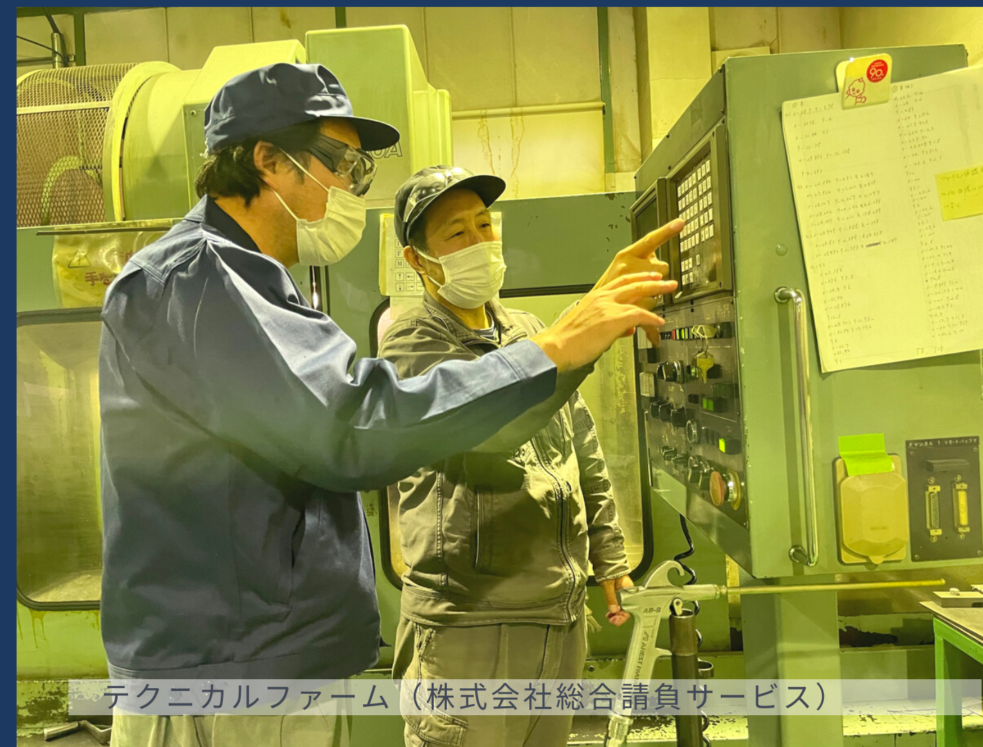
テクニカルファーム（株式会社総合請負サービス）